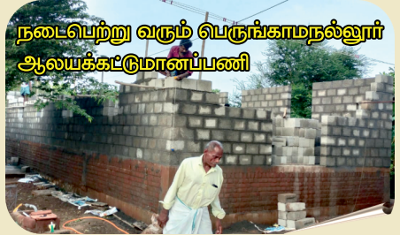
நடைபெற்று வரும் பெருங்காமநல்லூர் ஆலயக்கட்டுமானப்பணி

குக்கி அருட்பணியாளர்களை தாங்கி வருகிறது. ஒவ்வொரு அருட்பணியாளருக்கும் ரூ.15000/- ரூபாய்களை மாதந்தோறும் கொடுத்து வருகிறது. அதோடு கூட அவர்களைச்