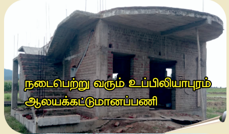
நடைபெற்று வரும் உப்பிலியாபுரம் ஆலயக்கட்டுமானப்பணி

ஊழிய இயக்கங்களையும் வெகுவாக பாதிக்கிறது. வடகிழக்கு மாநிலங்களிலிருந்து குக்கி அருட்பணியாளர்கள் வடமாநிலங்களுக்கு சென்றிருக்கும் நிலையில் அவர்களைத் தாங்கும் ஆலயங்கள் பல (360) இடிக்கப்பட்டு கிறிஸ்தவர்கள் அகதிகள் முகாம்களில் பிறர் தயவை நாடி இருக்கும்போது இந்த சபைகளால் அனுப்பப்பட்ட அருட்பணியாளர்களின் நிலை கேள்விக்குறியாக இருக்கிறது. என் சகோதரனுக்கு நான் காவலாளியோ? என்று இராமல் ICGM தற்போது 13