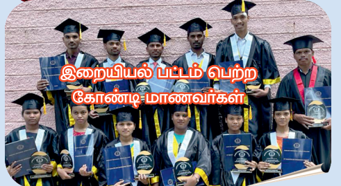
இறையியல் பட்டம் பெற்ற கோண்டி-மாணவர்கள்