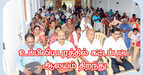
உப்பிலியபுரத்தில் கட்டப்பட்ட ஆலயம் திறந்து வைக்கப்பட்ட போது...